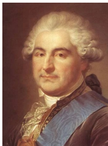
król Stanisław August Poniatowski