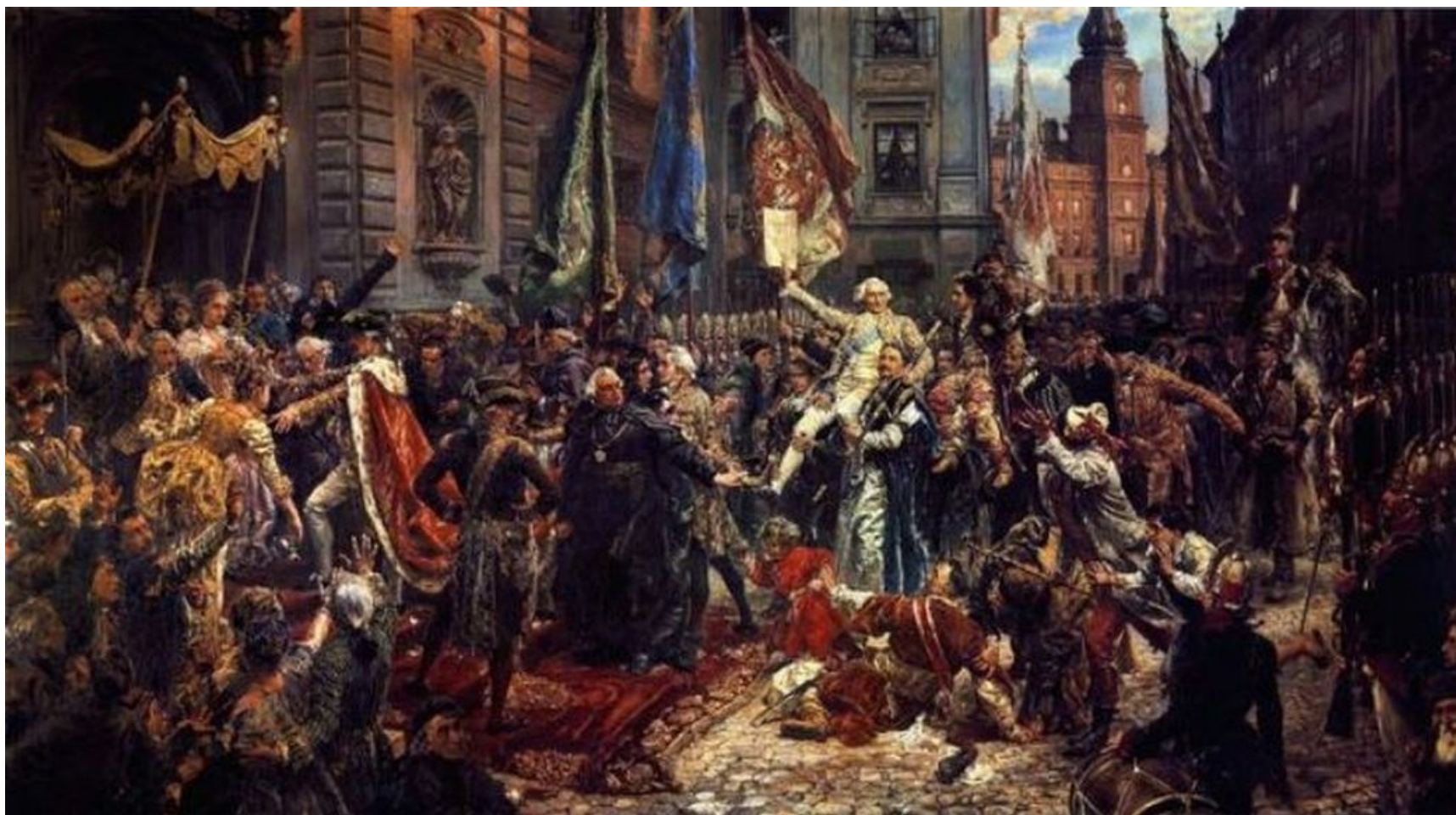
Jan Matejko, Konstytucja 3 Maja 1791 roku, 1891